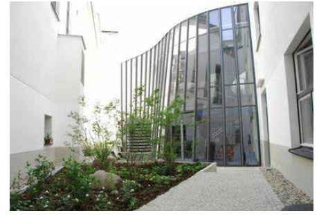
Redaktions- und Sendekomplex von Inforadio

Ziegelbau vor. Als das Haus des Rundfunks am 22.01.1931 feierlich eröffnet wurde, bestach es vor allem durch seine klare Formsprache.