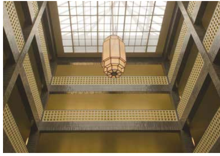
© Frank Schulze Großer Lichthof 2014