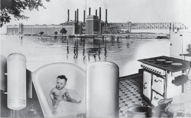
Abb. 4: Elektrische Geräte (im Vordergrund, im Hintergrund das Kraftwerk Klingenberg) wurden schnell zum Statussymbol der Moderne, und neue Anwendungstechniken eroberten den Privathaushalt.

house dominierten sie um 1900 den Weltmarkt, trafen Vereinbarungen zum Heimatmarktschutz und teilten den Rest der Welt untereinander auf 10 . Die Berliner Banken waren von Anfang an in die Aktivitäten der Konzerne involviert, da sie die Vorfinanzierung des kapitalintensiven Anlagenbaus sicherten. Kraftwerkstechnik und Straßensystem wurden in alle Welt exportiert. Zu den größten Auslandsinvestitionen des deutschen Kapitals vor dem Ersten Weltkrieg gehörte neben der Bagdad-Bahn das Lateinamerikageschäft der deutschen Elek-