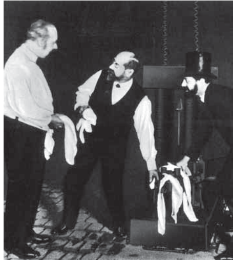
Abb. 3: Die öffentliche Stromversorgung in Deutschland lässt sich auf eine Testvorführung elektrischer Beleuchtung durch Emil Rathenau in einem noblen Berliner Restaurant 1882 zurückführen, mit der er die wichtigsten Akteure der Stadt von den Vorzügen der Elektrizität überzeugte – trotz technischer Probleme im Hintergrund.

nenstadt am Wasser gebaut und mit einem eigenen Hafen ausgestattet, um die Zufuhr der riesigen Mengen Kohle zu vereinfachen. Das Kraftwerk Oberspree ist das früheste Beispiel für diese Entwicklung in Berlin. Der öffentlichen Straßenbeleuchtung und dem Betrieb der ersten elektrischen Bahnen folgte innerhalb weniger Jahrzehnte der Anschluss nahezu aller Berliner Haushalte an das elektrische Versorgungsnetz. 9 Immer neue elektrotechnische Geräte wurden für ein Massenpublikum entwickelt; ihre Markteinführung wurde von massiver Werbung im öffentlichen Raum begleitet. Auch in der gesellschaftlichen Unterhaltungskultur ermöglichte Elektrizität völlig neue Anwendungstechniken; so entstanden zum Beispiel die Film- und die Musikindustrie.