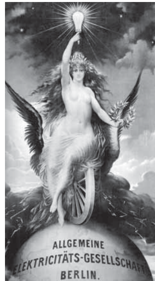
Abb. 5: Firmenzeichen der Allgemeinen Elektrizitäts-Gesellschaft (AEG), 1888

house dominierten sie um 1900 den Weltmarkt, trafen Vereinbarungen zum Heimatmarktschutz und teilten den Rest der Welt untereinander auf 10 . Die Berliner Banken waren von Anfang an in die Aktivitäten der Konzerne involviert, da sie die Vorfinanzierung des kapitalintensiven Anlagenbaus sicherten. Kraftwerkstechnik und Straßensystem wurden in alle Welt exportiert. Zu den größten Auslandsinvestitionen des deutschen Kapitals vor dem Ersten Weltkrieg gehörte neben der Bagdad-Bahn das Lateinamerikageschäft der deutschen Elek-