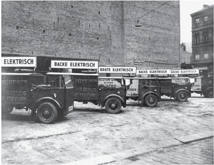
Abb. 6: Die neuen elektrischen Anwendungstechniken wurden auch im Stadtraum massiv beworben.

troindustrie 11 . Binnen weniger Jahrzehnte stiegen Berlin zur Metropole und Deutschland zur Exportnation auf, und während im Inneren der „Elektropolis“ Innovation entstand, wurde die Provinz personell wie materiell zum Rohstofflager – und die Welt zum Markt. Die in ihren Grundzügen bereits angelegte weltweite Arbeitsteilung zwischen den Regionen festigte sich, und die deutsche Industrie und Wirtschaft spielten dabei eine führende Rolle mindestens bis zum Ersten Weltkrieg. 12 Eine Interpretation des industriellen Erbes der Elektropolis Berlin muss deshalb über die Grenzen der Stadt hinaus denken, das Gesamtsystem internationaler Verflechtungen und Abhängigkeiten mit in den Blick nehmen und auch von der Peripherie aus wieder auf das Zentrum zurückschauen, um vollständig zu sein. Zu-