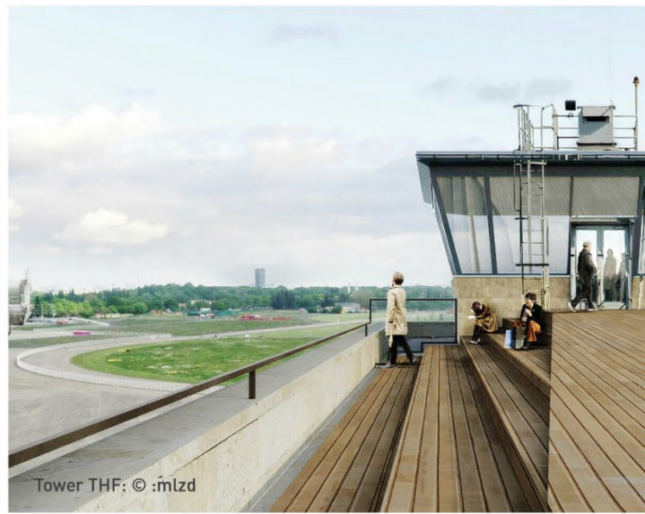
Tower THF