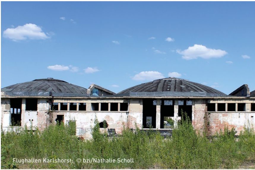
Flughallen Karlshorst: © bzi/Nathalie Scholl