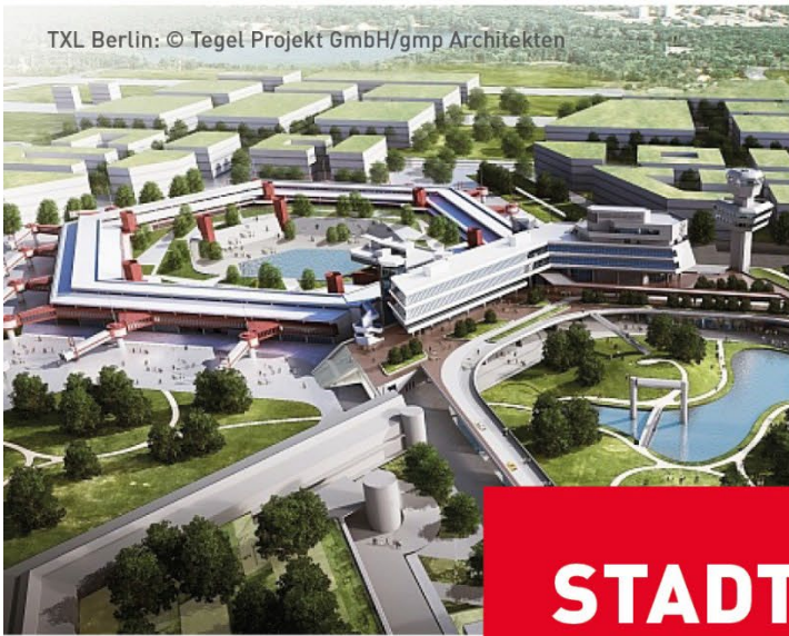
TXL Berlin: © Tegel Projekt GmbH/gmp Architekten